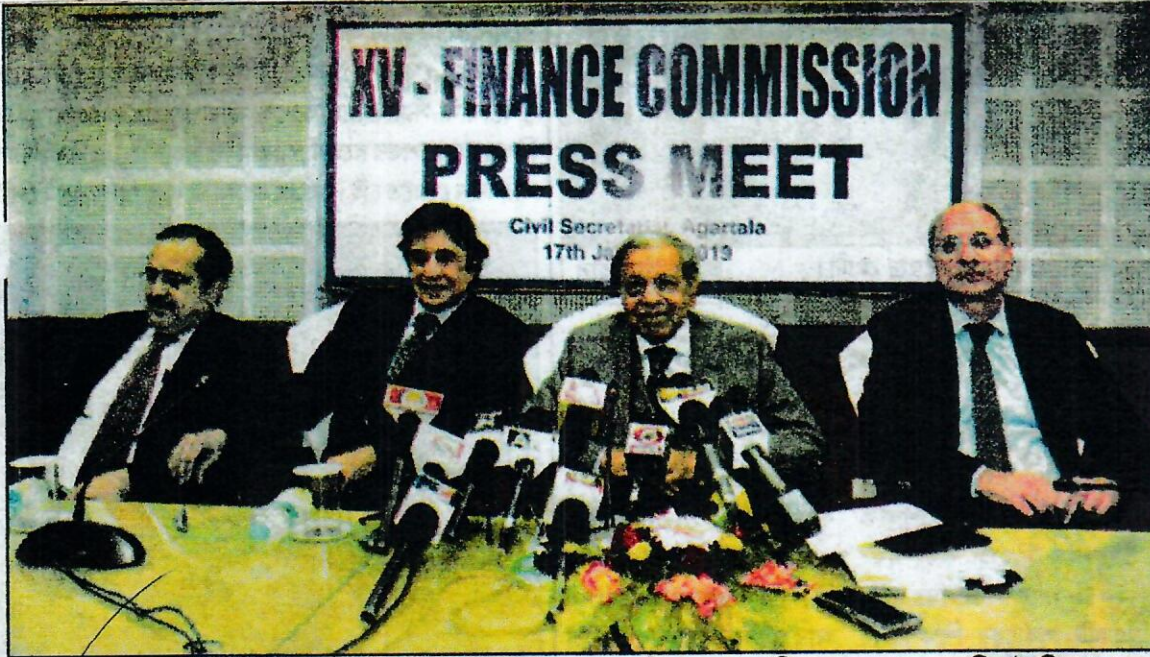
সচিবালয়ের কনফারেন্স হলে অর্থ কমিশনের চেয়ারম্যান এন কে সিং এর সাংবাদিক সম্মেলন।