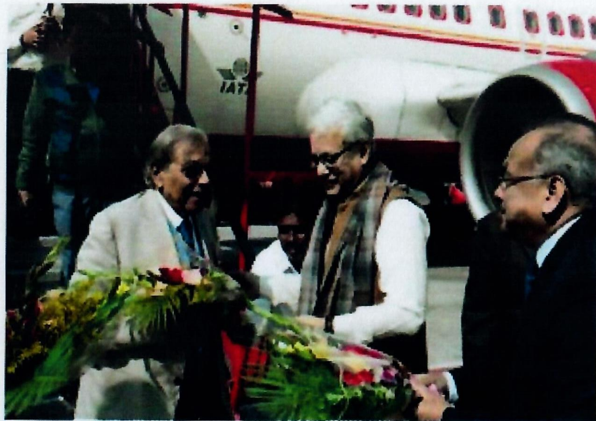
AGARTALA, JAN 16 (UNI)- N K Singh, Chairman, 15th Finance Commission being received by Tripura Deputy Chief Ministe Jishnu Debbarma at MBB Airport in Agartala on Wednesday.