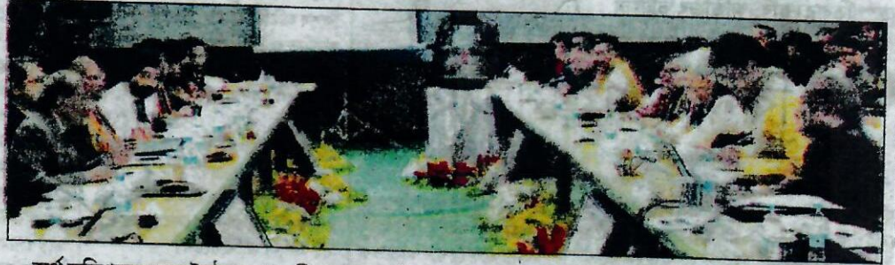
অর্থ কমিশনের সঙ্গে বৈঠকে মুখ্যমন্ত্রী ও রাজ্য মন্ত্রিসভার সদস্যরা। বৃহস্পতিবার। মহাকরণে।

অতীতপূর্বা রাজ্য সরকারের প্রশংসায় পঞ্চমুখ পঞ্চদশ অর্থ কমিশন। ত্রিপুরাকে 'মডেল' রাজ্য হিসেবে গড়ে তোলার জন্য মুখ্যমন্ত্রী বিপ্লবকুমার দেবের উদ্যোগে যথাসাধ্য সাহায্যের আশ্বাস দিয়ে গেলেন অর্থ কমিশনের চেয়ারম্যান ড. এন কে সিং। তবে চতুর্দশ অর্থ কমিশন রাজ্যের সঙ্গে বঞ্চনা করেছে বলে পূর্বতন বামফ্রন্ট সরকার যে-অভিযোগ করে আসছিল, এবার বিজেপি-আইপিএফটি সরকারও সেই অভিযোগের সত্যতা স্বীকার করে নিয়েছে। চেয়ারম্যান নিজেই জানানেন সে কথা। বৃহস্পতিবার মহাকরণে রাজ্য সরকারের পক্ষ থেকে অর্থ কমিশনের কাছে প্রেজেন্টেশন দেওয়া হয়। নেতৃত্বে ছিলেন মুখ্যমন্ত্রী বিপ্লবকুমার দেব। পরে মহাকরণেই সাংবাদিকদের সঙ্গে মিলিত হয় পূর্ণাঙ্গ অর্থ কমিশন। সাংবাদিক সম্মেলনে চেয়ারম্যান এন কে সিং বলেন, দু'দিনের সফরে রাজ্যে এসেছে অর্থ কমিশন। রাজ্যের বিভিন্ন স্বয়ংশাসিত সংস্থা, পঞ্চায়েত প্রতিষ্ঠানসমূহ, ত্রিপুরা উপজাতি এলাকা শাসিত জেলা পরিষদের পক্ষ থেকে কমিশনের কাছে প্রেজেন্টেশন দেওয়া হয়েছে। কমিশন গুরুত্বের